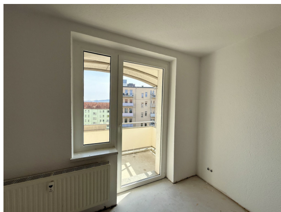
Schlafzimmer oder Wohnzimmer mit Balkon