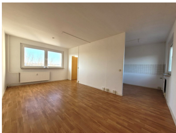
Wohnbereich mit offener Küche