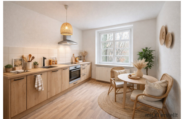
So könnte Ihre neue Küche aussehen!