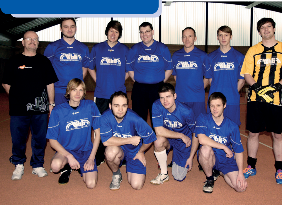
Unsere Mannschaft kurz vorm Spiel im Sportpark Plauen