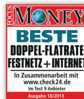
Focus Money Ausgabe 18/2013