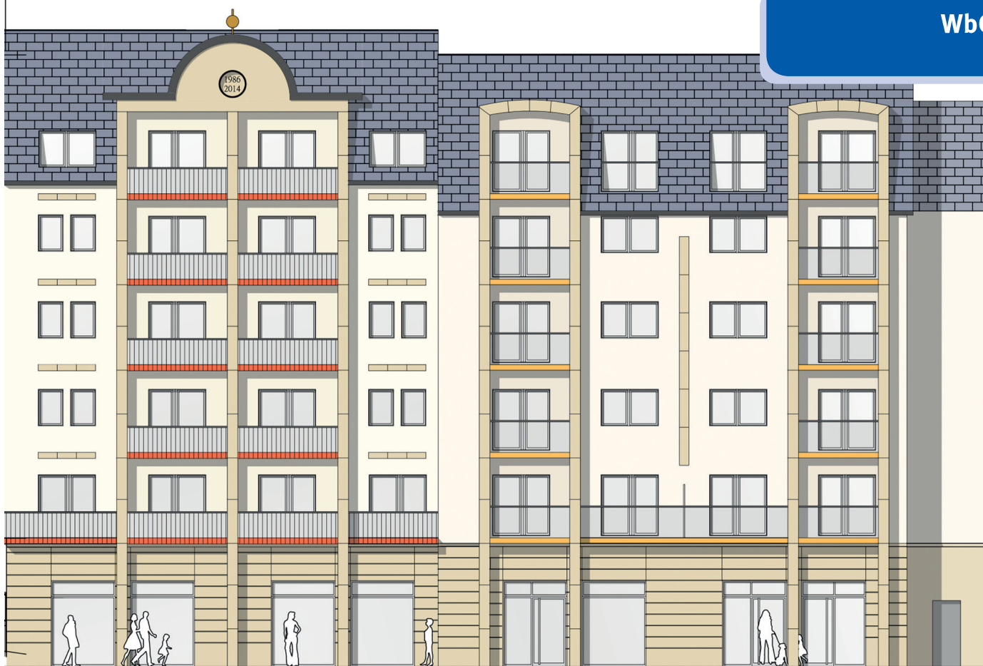
Entwurf Bahnhofstraße 26