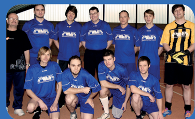
WbG Aktuell > S. 8 Harter Kampf beim Soccercup WbG-Mannschaft belegt 6. Platz