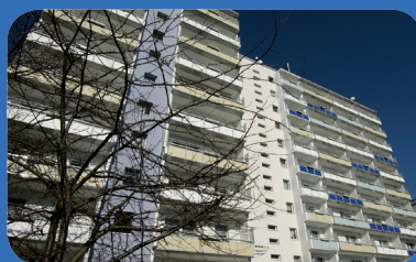
WbG Aktuell > S. 4-5 Hochhaus in neuem Gewand August-Bebel-Straße 1