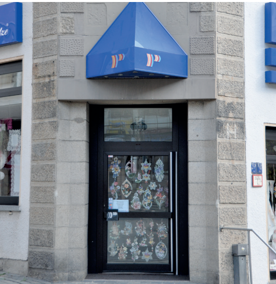
Geschäft von außen