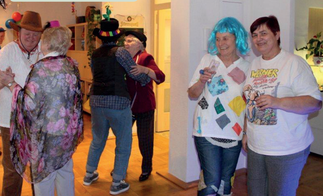
Unsere Mieter beim Feiern