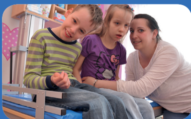
WbG zu Hause > S. 12 Spendenaktion unterstützt Familie Siems